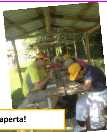
Pic Nic all'aria aperta!

Alcune foto del soggiorno estivo nella casa di Cappadocia dal 4 al 13 Agosto 2014