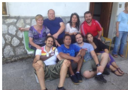
Siamo una squadra fortissima!