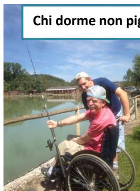
Chi dorme non piglia pesci!!!